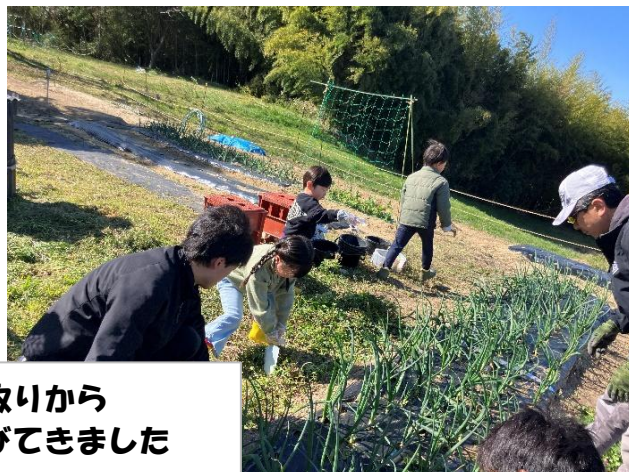
まずは、草取りから 玉ねぎも葉が伸びてきました