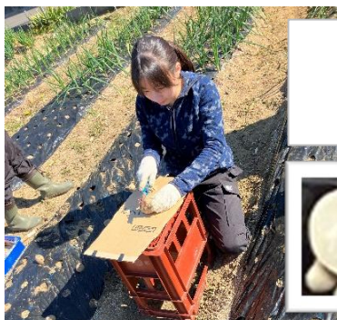
種いもを切り分けます (切り分けた種いもの両方に芽があるように)