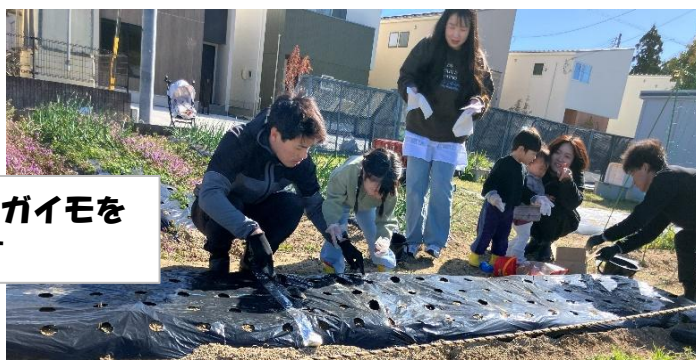
マルチ穴1個おきにジャガイモを 植えていきます