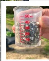
種イモ植付時の元 肥は40ml