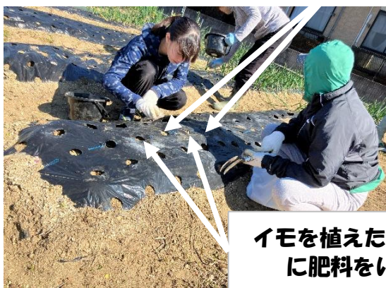
イモを植えた穴の間の穴 に肥料をいれます