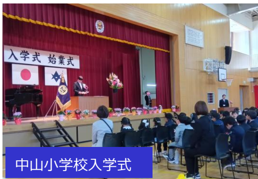
中山小学校入学式

4月8日（水）には中山小学校で、4月9日（木）には藤岡南中学校にてそれぞれ令和8年度の入学式が華やかに行われました。 新年度最初のイベントとして初々しい雰囲気の中、中山小学校新入生133名 藤岡南中学校新入生 100名が「ワクワク・ドキドキ」しながら新生活を迎えました。 特に藤岡南中学校の制服が本年度より新しくなり、初々しさをより輝かせていました。 新入生の皆さん、「おめでとうございます。」