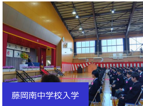
藤岡南中学校入学