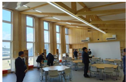
大きな窓で明るい図書室