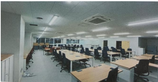
フリーアドレス化によりコミュニケーションを促進する職員室

全体的に明るい空間が快適で健やかな環境をイメージさせ、健康面や学習面での効果を期待させてくれる内覧会でした。