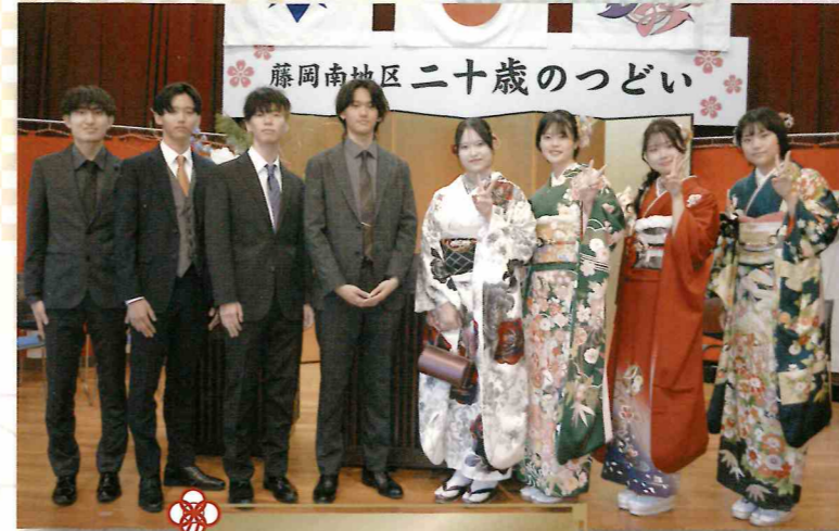
実行委員のみなさん