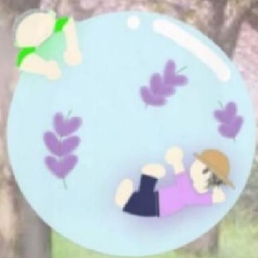
藤岡南交流館キャラクター 「ふーなん」

平成 25 年 3 月 策定 (令和 7 年 10 月 改定) 藤岡南地域会議 作成