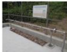
<災害拠点給水施設★>

水の必要量は、飲料水として1人当たり1日3リットル程度です。手洗い用や歯磨き用、洗浄作業用の生活用水を考慮すると、1人当たりの1日分の水の量は7.5～15リットルにもなります。4人家族の場合は3日でおおよそ120リットルの水が必要になります。できれば大きめの給水袋を用意すると安心です。給水袋がない場合は、大きめのゴミ袋を二重にしてリュックに入れると代用できます。また、スーツケースなどを使えば体への負担を軽減して運搬できます。