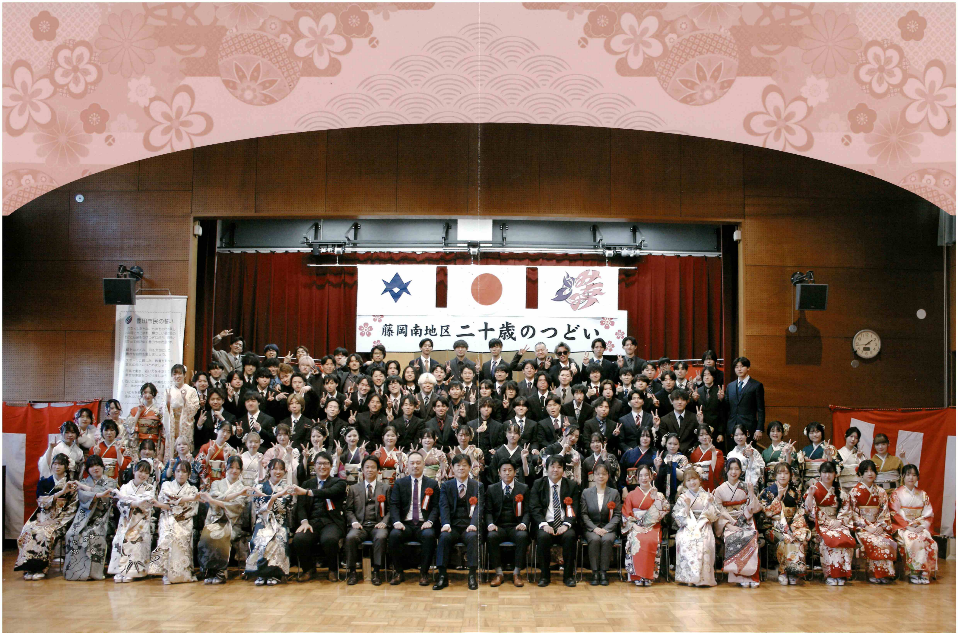
藤岡南地区 二十歳のつどい