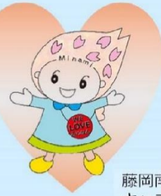
藤岡南地区コミュニティ会議 キャラクター 「みなみん」