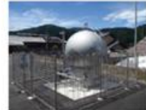
<飲料用耐震性循環式貯水槽▲>

地中にある耐震化された口径の大きな水道管から避難所等まで配水管を整備した応急給水所