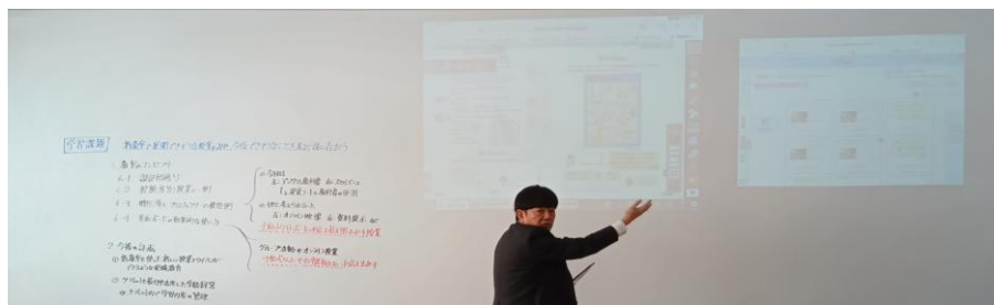
新しい時代の学び方に適応した普通教室