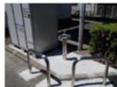
<応急給水支援設備●>

地中にある耐震化された口径の大きな水道管から避難所等まで配水管を整備した応急給水所