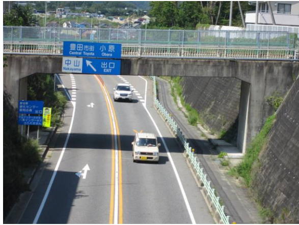
猿投グリーンロード 中山 I. C 付近