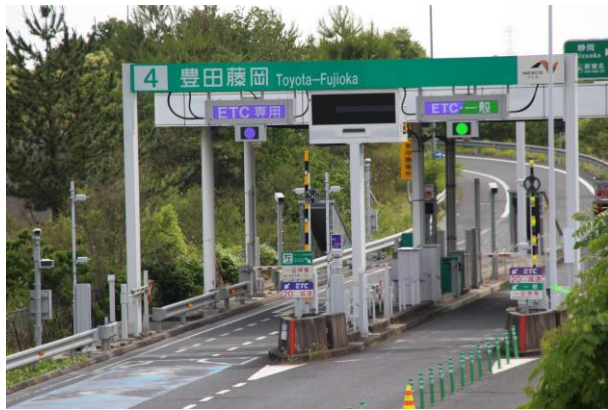
東海環状道 豊田藤岡 I. C