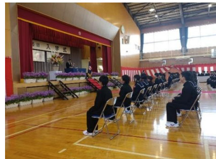
藤 岡 南 中 学 校 入 学