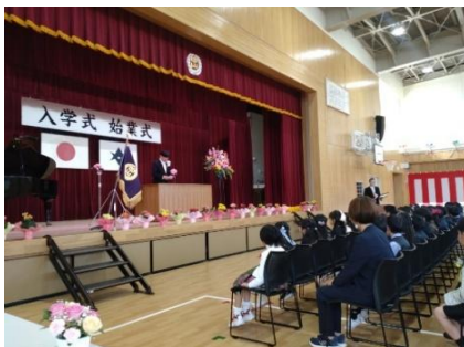
中 山 小 学 校 入 学 式

4 月 8 日 （ 火 ） に は 中 山 小 学 校 で 、 4 月 9 日 （ 水 ） に は 藤 岡 南 中 学 校 に て そ れ ぞ れ 令 和 7 年 度 の 入 学 式 が 華 々 か に 行 わ れ ま し た 。 新 年 度 最 初 の イ ベ ン ト と し て 初 々 し い 雰 囲 気 の 中 、 中 山 小 学 校 新 入 生 124 名 藤 岡 南 中 学 校 新 入 生 92 名 が 「 ワ ク ワ ク ・ ド キ ド キ 」 し な が ら 新 生 活 を 迎 え ま し た 。 新 入 生 の 皆 さ ん 、 「 お め で と う ご ざ い ま す 。 」