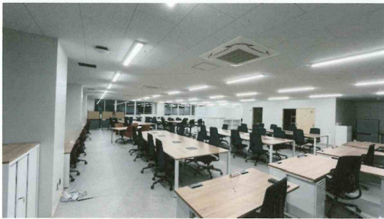
職員室 フリーアドレス化し、コミュニケーションを促進する。