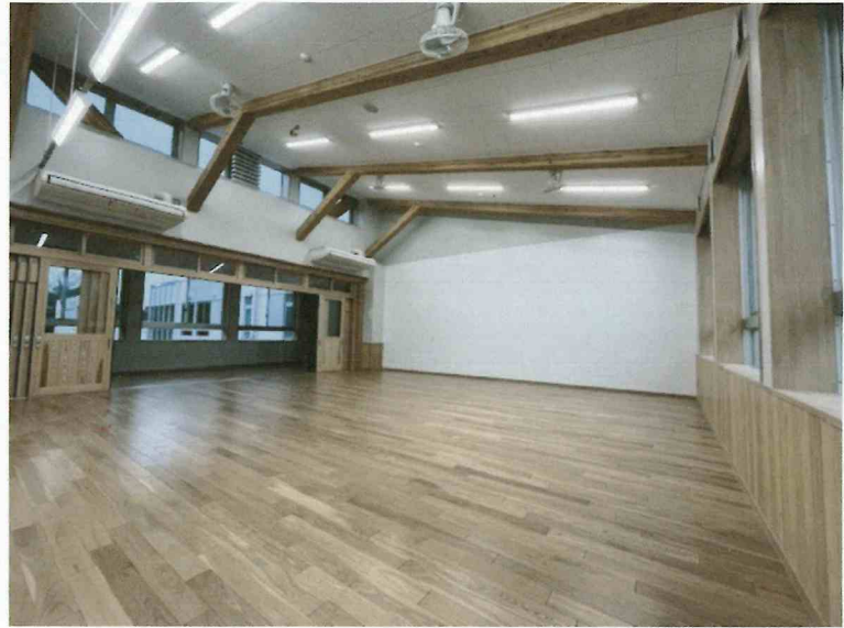
左：普通教室前面 右：普通教室背面 ホワイトボード壁を採用し、多彩な授業に対応する。