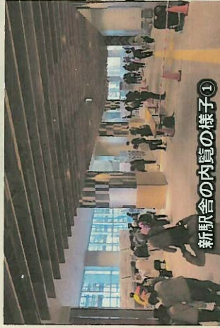
新駅舎の内覧の様子①

3月28日(土)の高架切替に先立ち、3月8日(日)に各自治区（若林地区4自治区及び若園地区3自治区）主催による、地元住民対象の内覧会が開催され、約2,000名の方がご参加くださいました。