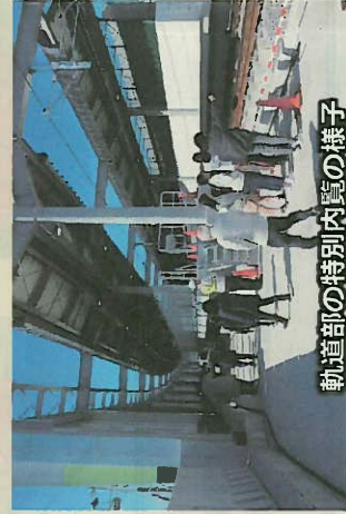
軌道部の特別内覧の様子