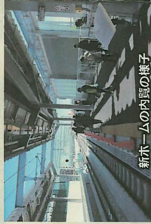
新ホームの内覧の様子