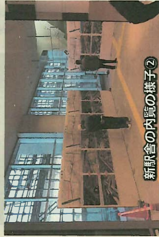
新駅舎の内覧の様子②