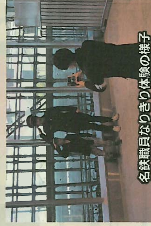
名鉄職員なりきり体験の様子