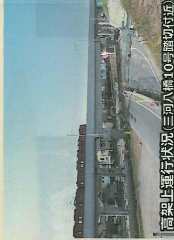
高架上運行状況(三河八橋10号踏切付近)