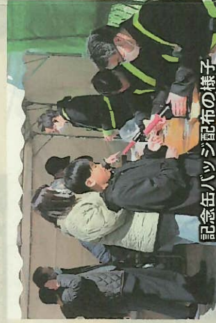
記念缶バッジ配布の様子