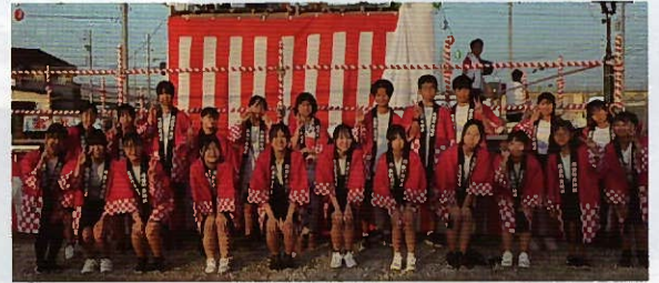
▲中学生ボランティアの皆さま