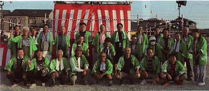
▲自治区役員・区会議員の皆さま