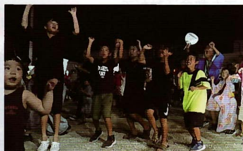
▲友達と一緒に楽しみました