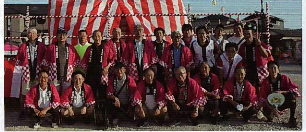
▲花園町まつりサポート会 ソフトボールリーグ・厄年会の皆さま

花園町まつりサポート会、花園ちゃちゃちゃ、子ども会、中学生ボランティア、わかっ茶、ソフトボールリーグ、厄年会、花園自警団、自治区役員・区会議員の皆さま、炎天下の中での準備、また、当日の運営、片付け、お疲れ様でした。大きな事故やケガも無く、無事に夏祭りを開催できて良かったです。