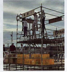
▲中央やぐらの設営

🐛 来年は記念すべき『第50回』になります。皆さんお誘いあわせの上、夏祭りにお越しください