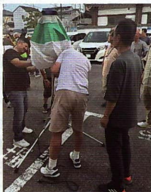
▲バルーンライト組立ての様子

7月5日（土）19時～区会議員対象で夜間防災訓練が行われました。花園町自治区防災隊員の指導により、自家発電装置の始動訓練、バルーンライトの設置訓練を行いました。発電機や道具類は、いざという時に困らないように、防災隊の訓練分科会が2か月に1回点検しており、年1回は業者による点検も行っています。