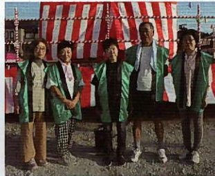
▲わかっ茶の皆さま