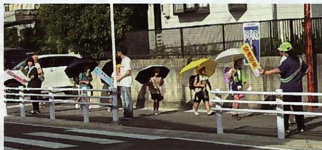
▲見守り隊の皆さまに護られて横断歩道を通行する小学生