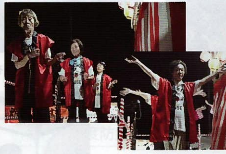
▲花園ちゃちゃちゃの皆さま