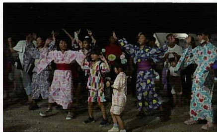
▲踊りを楽しむ浴衣姿の子どもたち