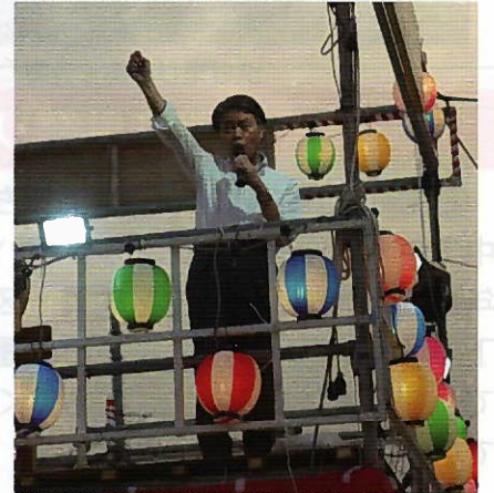
▲太田市長よりご挨拶いただきました

8月13日(水)14日(木)にて、花園町夏祭りを花園中央公園予定地で開催しました。メインの踊りはもちろん、輪投げやスーパーボールすくいといった子ども向けのゲーム也大盛況で、露天商やキッチンカーも、踊りが始まる前からすごく賑やかでした。延べ2,600名を超える区民の皆さまにご来場いただきありがとうございました。