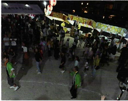
▲櫓の周りで踊る参加者