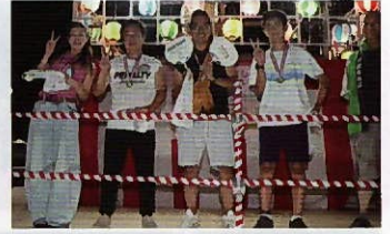
▲踊りコンテスト 金メダリスト(優秀賞受賞)の皆さまと表彰台で記念撮影