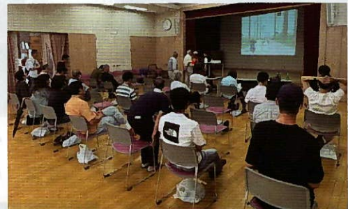
▲区民会館 大ホールでの講習会の様子

6月2日(日)に花園町自治区防災隊主催で花園町区民会館にて心肺蘇生講習会が開催されました。胸骨圧迫方法の実技、AEDの使い方を学びました。南消防署指導員の皆さまより、実体験を交えた分かりやすい説明をいただきました。AEDを使用すれば一般の人でも救命活動ができるため、受講されていない方、また数年講習を受けられていない方はぜひ、次回のご参加をお待ちしております。