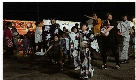
▲大人も子供も全員で踊りました