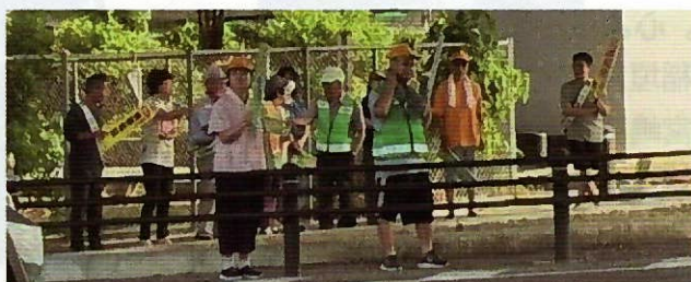
▲安全運転への呼びかけ、プレートにて注意を促しました