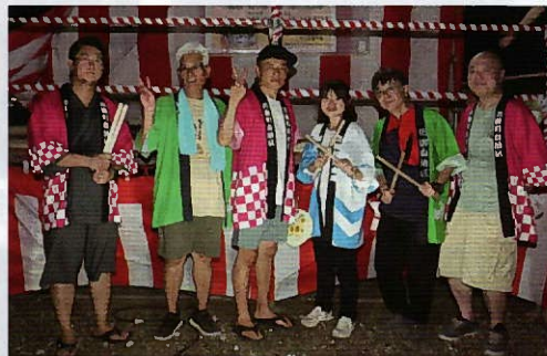
▲祭りを盛り上げる太鼓を演奏した皆さん