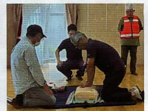
▲AED・胸骨圧迫の実習