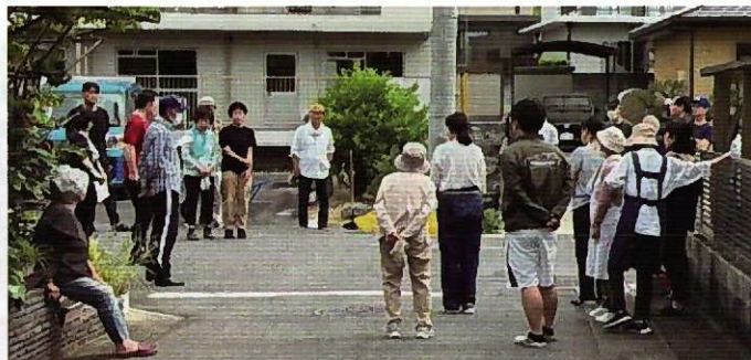
▲活動後はミニ集会を実施しました