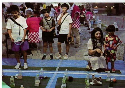
▲輪投げ也大盛況でした