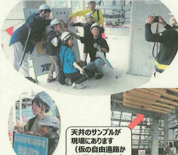
天井のサンプルが 現場にあります （仮の自由通路から も見えますよ☆）