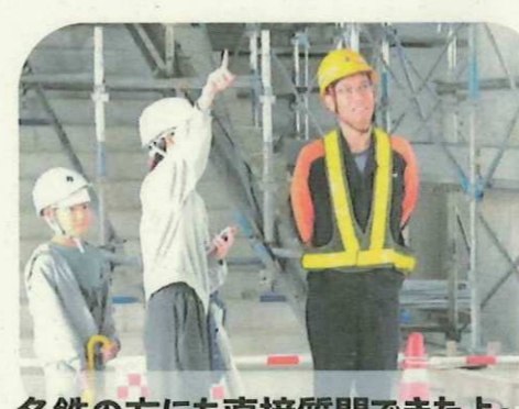
名鉄の方にも直接質問できたよ～☆