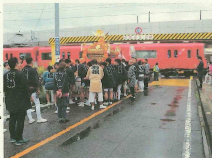
電車を背景にした写真

どうぞ皆さまの心の中にも、この懐かしい風景をそっと残していただき、地域の移りゆく姿を共に見届けていただければと思います☆