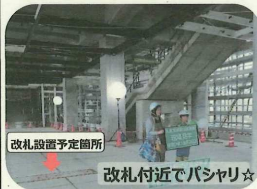
改札設置予定箇所