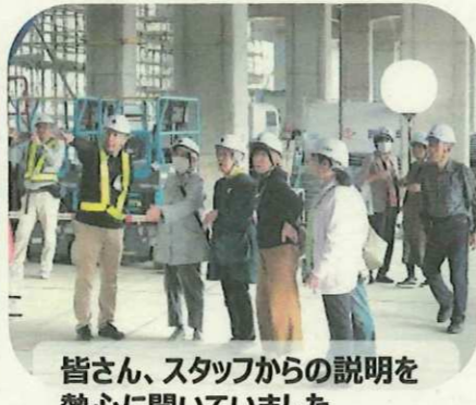
皆さん、スタッフからの説明を 熱心に聞いていました