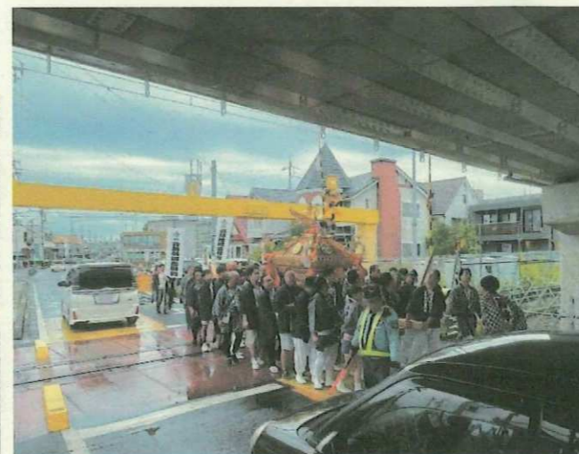
神輿が踏切を渡る写真