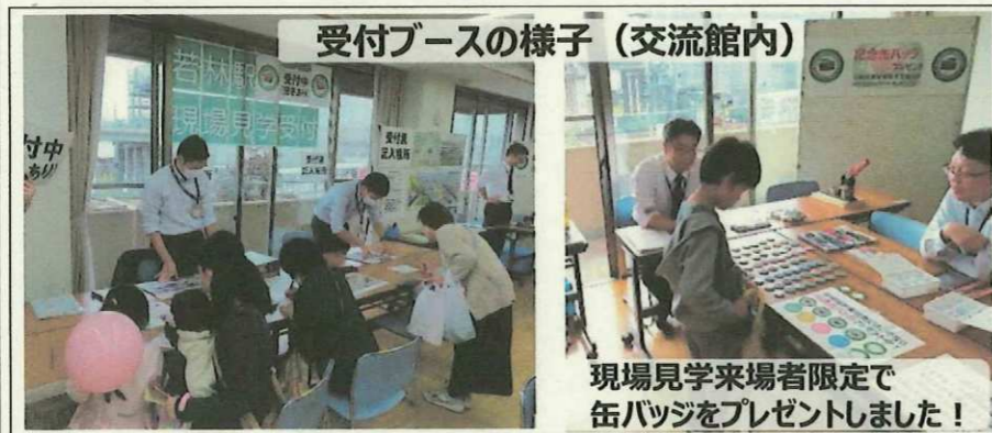
受付ブースの様子（交流館内）

今回のイベントを通じて、地域の皆さまの本事業に対する関心の高さを改めて認識し、引き続き、令和8年3月に予定している高架切替えに向けて、着実に整備を進めてまいります。