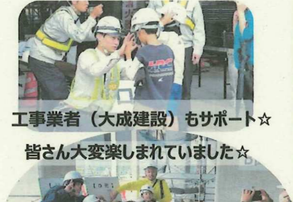
工事業者（大成建設）もサポート☆ 皆さん大変楽しまれていました☆