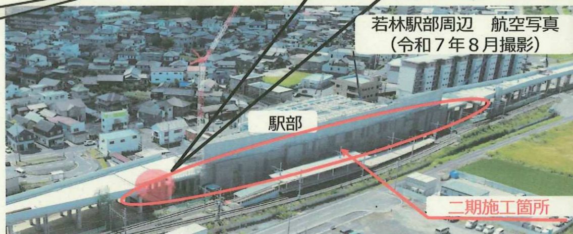
若林駅部周辺 航空写真（令和7年8月撮影）

A2. ○部分については、4線のうち1線部分は、現在仮線が設置されているため（下図参照）、仮線が撤去されなければ施工できません。このため、仮線撤去後の『二期施工』が必要となります。