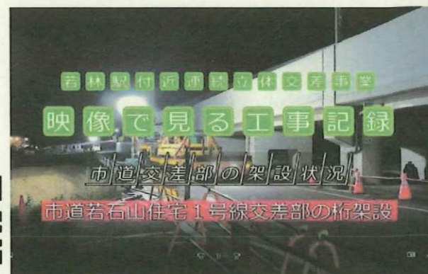
（例）『市道若石山住宅1号線交差部の架設』