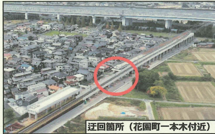
迂回箇所（花園町一本木付近）

期間：令和7年2月中旬～ 令和7年5月下旬（予定） 時間：終日 場所：花園町一本木付近の鉄道と交差する歩行者通路 迂回路：工事ヤード内に通路を設置 施工業者：戸田建設(株)