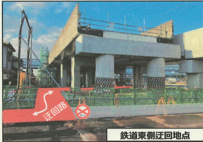
鉄道東側迂回地点