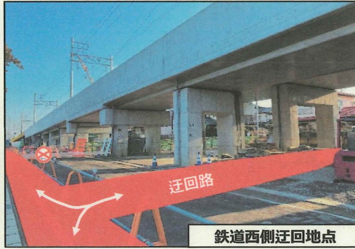
鉄道西側迂回地点