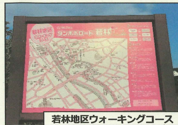
若林地区ウォーキングコース