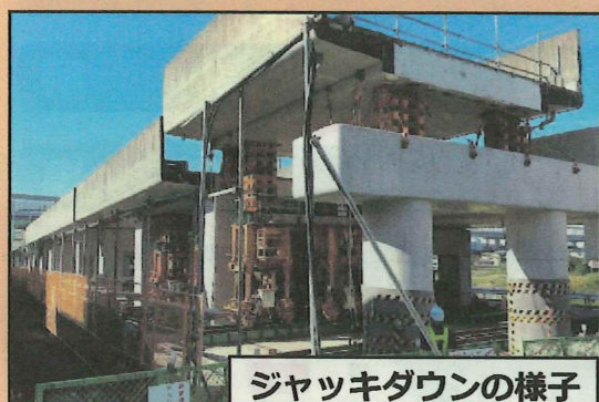
ジャッキダウンの様子