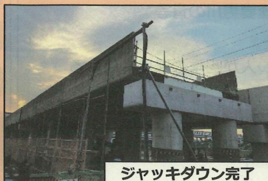
ジャッキダウン完了