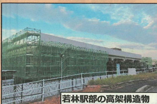
若林駅部の高架構造物