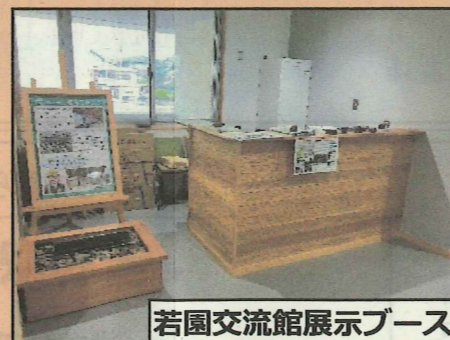
若園交流館展示ブース