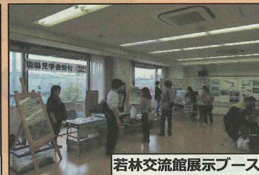
若林交流館展示ブース