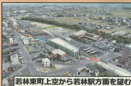
若林東町上空から若林駅方面を望む

若林駅部は2面4線幅の整備となるため、たくさんの柱が立ち上がり、着実に工事が進んでいます。