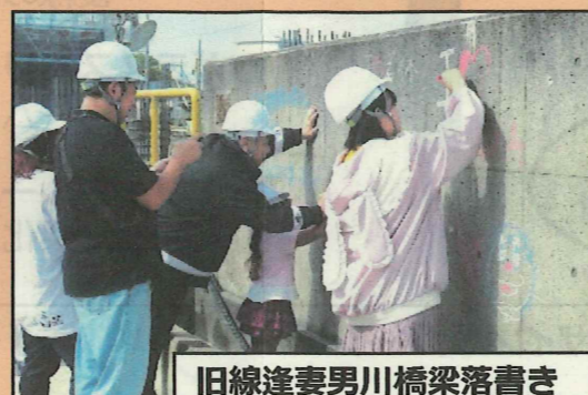
旧線逢妻男川橋梁落書き

若林ふれあいまつりにあわせて現場見学会を開催しました。「旧線逢妻男川橋梁」への落書きでは工事関係者への温かいお言葉をいただきました。