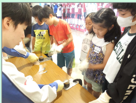
②加工 平版を金づちで スプーンに加工