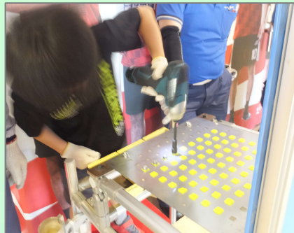
①組立て 電動ドライバーで ネジの取り付け作業