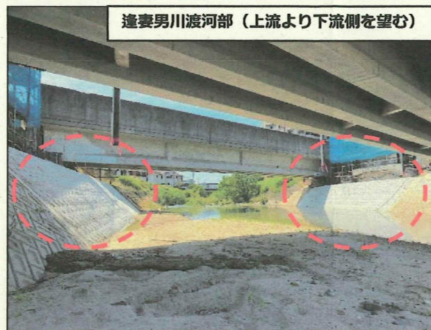
逢妻男川渡河部（上流より下流側を望む）