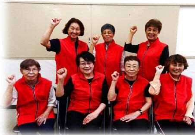
啓発寸劇ボランティア おとひめ