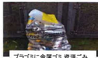
プラゴミに金属ゴミ、資源ごみ