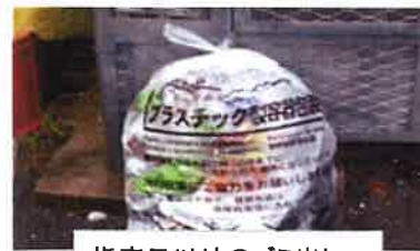
指定日以外のゴミ出し