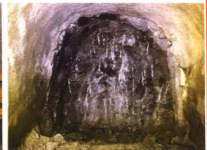
切羽(トンネル先端)の状況(264.4m位置)