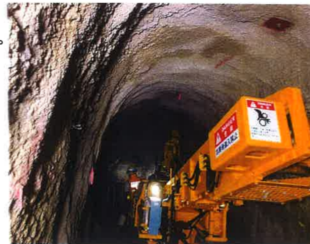
岩石の積込み状況