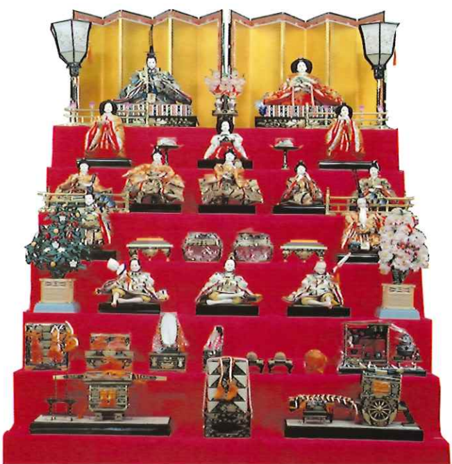
屏風段飾りひな人形 昭和49年