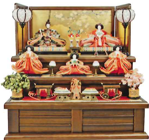
屏風段飾りひな人形 平成15年

当館は昭和57年11月に開館し、2回目の企画展示として昭和58年1月に「ひなまつりと能楽展」を開催いたしました。以来、毎年ひな人形展を開催し、今回で42回目を迎えました。この間に実に多くの皆さまからひな人形のご寄贈を賜りました。改めてご寄贈賜りました皆さまをはじめ、ご支援・ご協力を賜りました皆さまに、厚く御礼申し上げます。