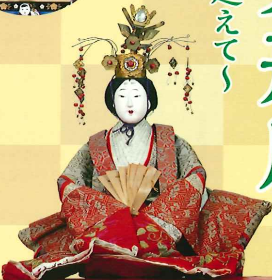
内裏ひな人形 (明治39年)