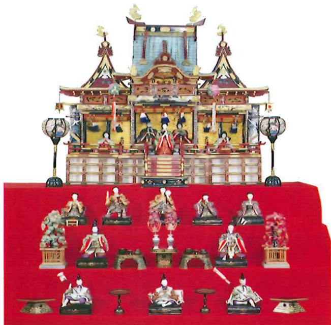
御殿飾りひな人形 昭和29年