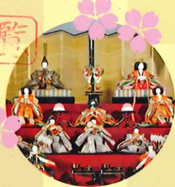
屏風段飾りひな人形 (平成元年)