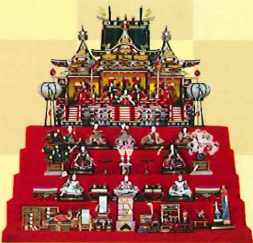
御殿飾りひな人形 (昭和29年)