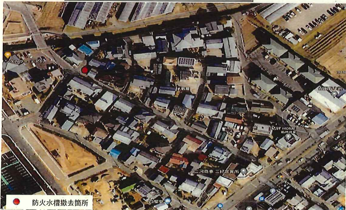
● 防火水槽撤去箇所